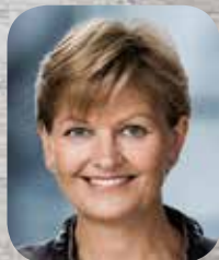
Eva Kjer Hansen Miljø- og Fødevarerminister