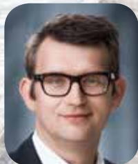
Troels Lund Poulsen Erhvervs- og Vækstminister