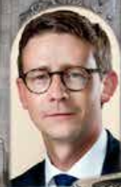
Karsten Lauritzen Skatteminister