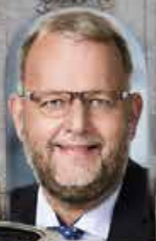
Lars Christian Lilleholt Energi-, Forsynings- og Klimaminister