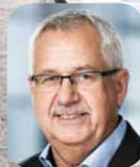
Hans Chr. Schmidt Transport- og Bygningsminister

Onsdag den 7. og torsdag den 8. oktober 2015